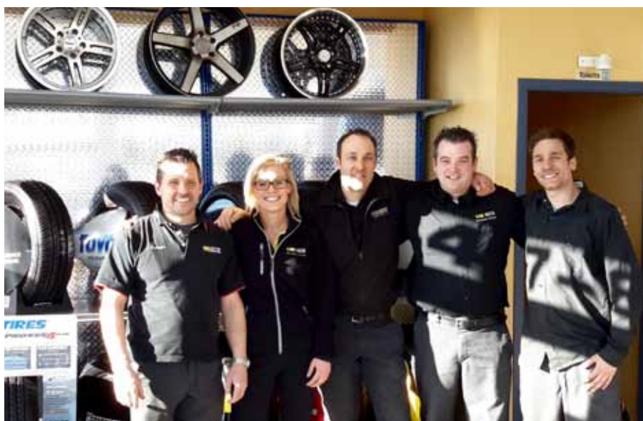
L'équipe du garage OK Pneus de Chambly a obtenu la mention OR dans le cadre du programme Clé Verte.

« Oui, beaucoup de questions surgissaient.